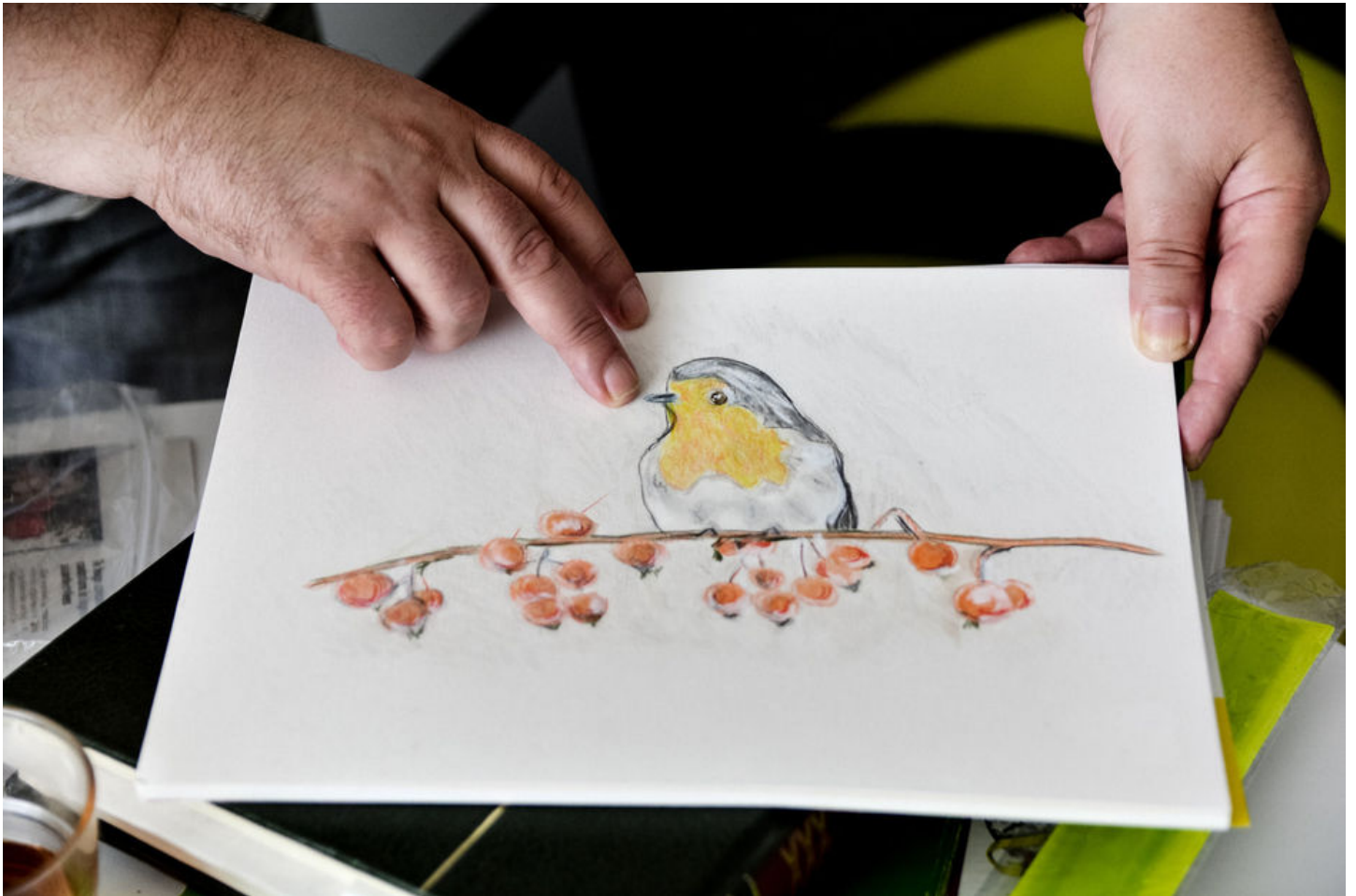
De nieuwste creatie van K.

Buiten op straat horen we jongeren roepen en lachen. K. kijkt amper op. Bij een icetea praten we rustig verder over de muziek van Laurie Anderson en de kunst van Joseph Kosuth . 'Een droom die ik had over mollen, wil ik graag uitwerken tot een stripverhaal', vertelt K. over een nieuw project. 'De mollen kwamen goed overeen, tot er ineens een mol kwam die zich sterker voelde dan de anderen. Ze groeven gangen waardoor huizen instorten. Het laatste prentje van het stripverhaal is dan helemaal zwart, niets anders.'