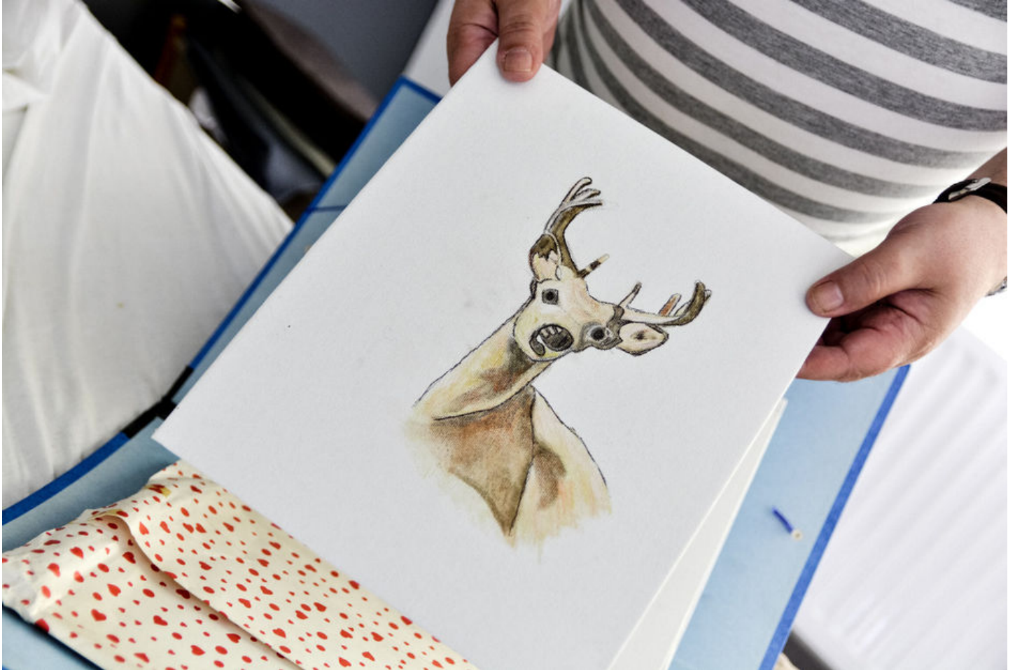
Een kunstwerk van K., die woont in het psychiatrisch verzorgingstehuis Leilinde.

Bijna tweeduizend Vlamingen wonen in een psychiatrisch verzorgingstehuis. Drie bewoners van zo'n centrum in Dendermonde geven Knack een inkijk in hun leven. Voorbij het taboe en de argwaan.